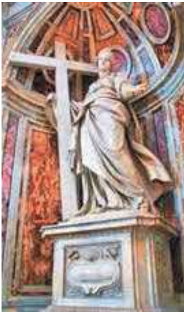
4. Statua di Sant'Elena nella basilica di San Pietro in Vaticano (Wikipedia)