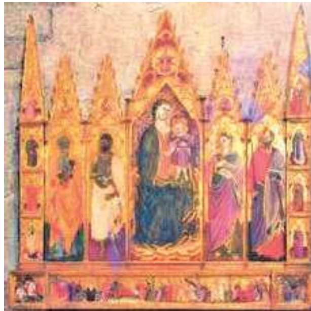
5-6. Polittico di Francesco Zacchi detto il Balletta nella chiesa di San Giovanni in Zoccoli a Viterbo, con particolare di Sant'Elena sul pilastro laterale destro (ph. dell'autore)