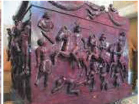
3. Sarcophago di Elena ai Musei Vaticani

Nel 305 Costanzo, divenuto imperatore, portò con sé il figlio trentenne in Britannia in guerra contro i Pitti. Costantino fu così valoroso che l'esercito lo acclamò subito successore e fu rapidamente acclamato imperatore nel 306, dopo la morte di Costanzo; è quindi probabile che in questo periodo Elena abbia seguito il figlio. Successivamente Costantino si stabilì a Roma e qui la presenza di Elena è legata al fundus Lauretus , nella zona sud-orientale della città antica, dove venne edificato anche il palatium Sessorianum , in seguito venne costruita anche la chiesa dei Santi Marcellino e Pietro riconducibile ad Elena come progettazione ed edificazione, insieme all'annesso mausoleo detto di Elena, in quanto lei fu sepolta proprio in questo edificio. Lei godette dell'ascesa del figlio al potere, che nel 324 la onorò del titolo di "Augusta"; in suo nome furono coniate molte monete, in cui Elena viene personificata come Securitas dello stato (fig. 2). Elena morirà, come accennato, nel 329 assistita dal figlio e venne sepolta in un sarcofago in porfido rosso, oggi conservato ai Musei Vaticani (fig. 3), proveniente dal mausoleo a lei intitolato sulla via Casilina, corrispondente al III miglio dell'antica via Labicana; nel 1154 le reliquie vennero traslate nella basilica di Santa Maria in Aracoeli.