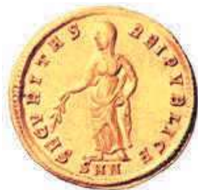
2. Monete coniate, in cui Elena è la personificazione della Securitas dello stato

vette lasciare con tanta tristezza la bella Elena per volere di Diocleziano e sposare la figliastra di Massimiano, Teodora, allo scopo di cementare con un matrimonio dinastico la sua elevazione a "Cesare" effettivo all'interno della tetrarchia, ed Elena dovette farsi da parte perché non era degna di prendere parte alla corte imperiale. Costanzo avrà altri sei figli, tre maschi e tre femmine, ma riconobbe Costantino come primo erede e gli fece impartire un'ottima educazione militare alla corte di Diocleziano, ormai divenuto imperatore dopo Massimiano. Elena non si risposò mai e visse lontano dalle corti imperiali, comunque rimase sempre vicina al figlio, che per lei aveva una devozione particolare.