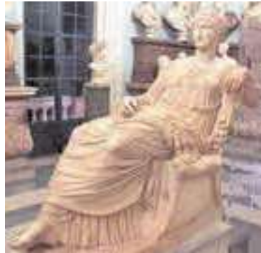
1. Statua di Flavia Giulia Elena del IV secolo conservata ai Musei Capitolini, ritenuta in origine essere Agrippina Minore

Non è noto quando Elena incontrò il suo futuro marito Costanzo Cloro, ma lo storico Timothy Barnes ritiene che l'incontro ebbe luogo quando Costanzo, all'epoca comandante al servizio dell'imperatore Aureliano, era stazionato in Asia Minore per la campagna militare contro il Regno di Palmira. Elena diede alla luce Costantino nel 274 a Naissus , una città romana situata lungo il fiume Nišava, nell'attuale Serbia, dove oggi sorge la città di Niš . Costanzo nel frattempo avrà una rapida e brillante carriera politica tanto da diventare quasi "Cesare" e vice dell'imperatore Massimiano, spartendo il potere nella tetrarchia con Diocleziano e Galerio. Nel 293 Costanzo do-