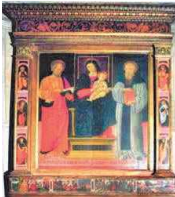
7-8. Pala d'altare dell'artista D'Avaranzano nella chiesa San Marco a Viterbo, con dettaglio di Sant'Elena

Elena, che nell'etimologia greca significa splendente o splendore della fiaccola, nell'iconografia viene rappresentata con gli attributi della corona imperiale, il manto regale, la grande croce (fig. 4) e a volte ha vicini tre chiodi e un martello. Probabilmente l'abito bianco da lei indossato e pre-