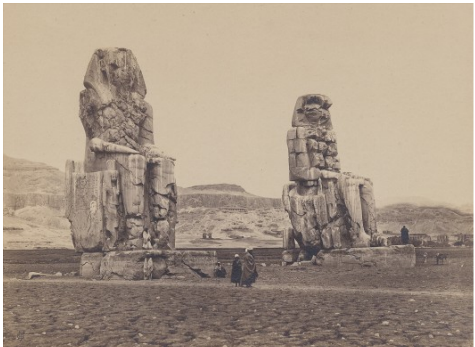
Frank Mason Good, Colossi of Memnon, Qurna 1869.

I rapporti tra l'Italia e l'Egitto, sia a livello politico che culturale, sono stati da sempre forti e fecondi, molto prima della moda scoppiata in Europa a seguito della spedizione di Napoleone Bonaparte, che però ebbe il merito di "riproporre" la terra dei Faraoni all'attenzione del grande pubblico.